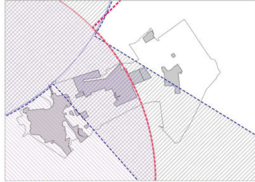
Схема с отображением зон ограничений от аэродромов

Карта градостроительного зонирования с отображением зон с особыми условиями использования территории Бабяковского сельского поселения Новоусманского муниципального района Воронежской области